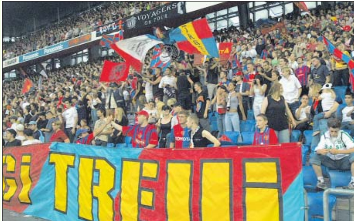
Vielleicht können die Fans den FCB künftig zu den Klängen der Stadtmusik Basel empfangen.