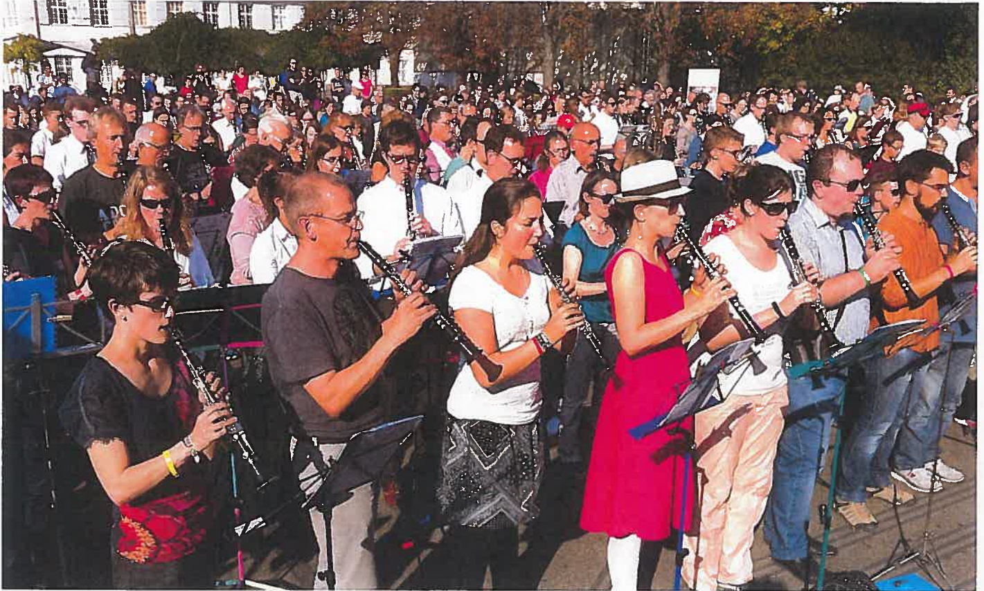
Das Jahr der Klarinette inspirierte verschiedene Musikvereine zu besonderen Aktionen. In Basel etwa entstand das grösste Klarinettenorchester der Welt. L'année de la clarinette a incité différentes sociétés de musique à sortir des sentiers battus. A Bâle, il s'est formé le plus grand orchestre de clarinettes du monde. L'anno del clarinetto ha ispirato diverse società bandistiche a proporre azioni particolari. A Basilea si è esibita la più grande orchestra di clarinetti al mondo.